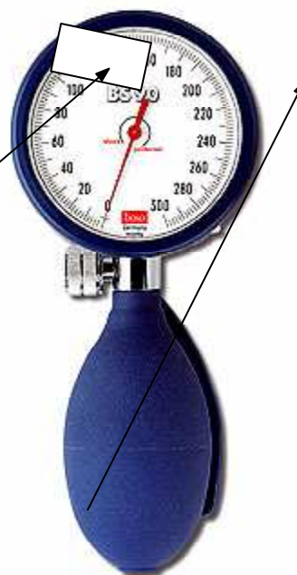
roid I (bs 90)